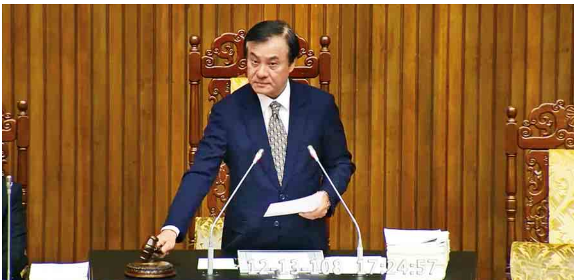
《律師法》修正已於民國108年12月13日經立法院三讀通過。

在民國108年12月13日三讀通過。修法條文由53條大幅增至146條，為1941年《律師法》頒布後最大幅度修正，在減少執業障礙、律師淘汰制度、懲戒制度及社會公益服務等面向有顯著變革。具體施行細節將由改制後的「全國律師聯合會（全律會）」制定章程，台北律師公會籲請所有律師同業持續關注，確保新《律師法》能真正落實。