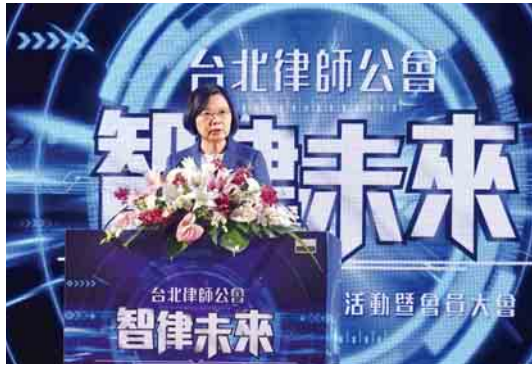
總統蔡英文於民國 108 年 9 月 9 日出席第 72 屆台北律師公會律師節慶祝大會時表示，期待律師界攜手合作，讓草案早日通過，回應民眾對司法改革的期待。