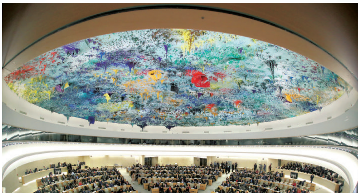
聯合國人權理事會，負責全球範圍內加強促進和保護人權，解決人權侵犯問題以及對此提出建議。

監察院已依今年公布生效之監察院國家人權委員會組織法之規定，明訂此法應於今年5月1日施行。這是我國首次依據1993年12月20日之聯合國關於設置國家人權機構的巴黎原則，立法設立國家人權委員會正式運作。